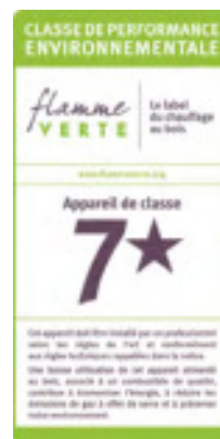
Étiquette énergétique Flamme Verte